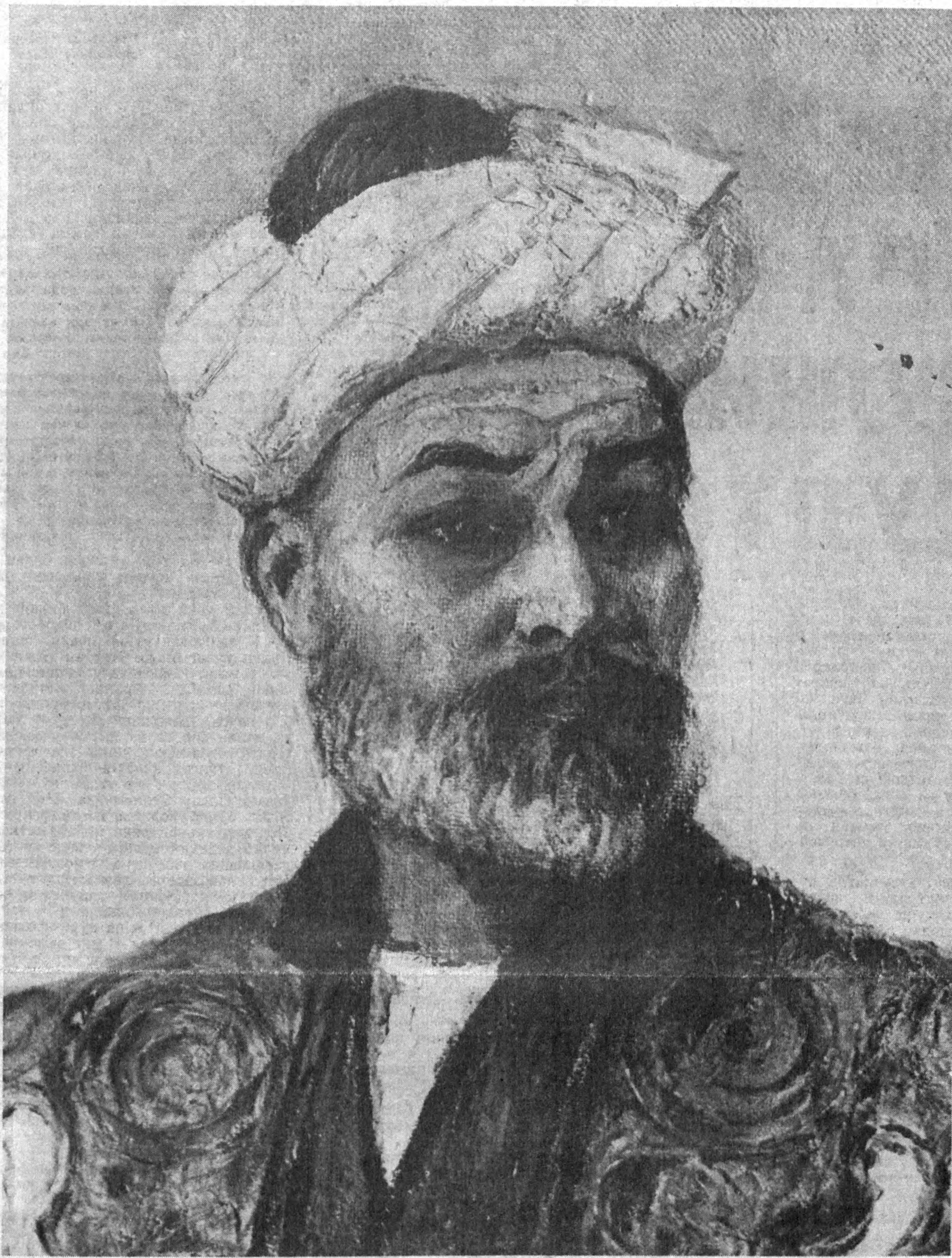
Ўзбек тасвирий санъати ҳам ўзининг навоийномаси билан эл эътиборига тушган. Турли авлодга мансуб rassomlar gazal mulki sultonining 550 йиллик тўйига муносиб совғалар — янги-янги асарлар билан келдилар. Бу ижод намуналари Ўзбекистон Рассомлар уюшмасининг марказий залида куни кеча очилган юбилей кўргазмасида намойиш этилмоқда.