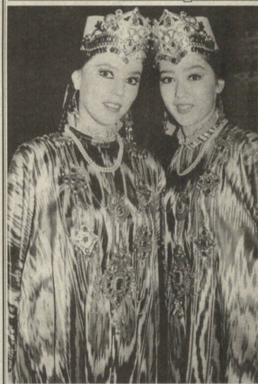
Ох чӣ сеҳрест дар ин дидаву миғнони ту? Мавҷи ҳаёти шакарин аст дар ин печутоб.