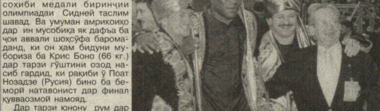
Ҳамин тарик шохсўфаи аввал танҳо ба паҳлавонони Русия, Ўзбекистон ва ИМА насиб гардид, ки дар оғози мусобиқа низ маҳз намояндагони ин мамлакатҳо довтолбани асосӣ буданд.

Барои Ўзбекистон бошад, мусобиқаи аввалӣ — шашуми Чоми истиқлол ва имтиҳон дигаре буд барои он ки дар солҳои наздик оё метавонад соҳиби майдони чемпионати ҷаҳон гардад, зеро ки аз рӯи тахминҳо барои баргустариш чунин мусобиқаи ҷаҳонӣ паҳлавонон арзида додааст.