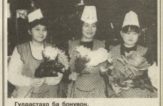
Гулдастаҳо ба бонувон.

То соли 1975 барои занони Фаронса сӯқути қудайи ба ғани ва истифода аз василаҳои зидди қиҳоме низ маънӣ буд ва дар он сол ин иқозат бароқишон дода шуд, ки қабл аз он иборат сӯқути фарзанди ба ғани онҳо водор мешавад, ки ба ҳоричи кишвараванд. Ва паси ҳам қонуноҳи дигар барои ҳимояи ҳуқуқҳои иҷтимоии занон қард қардиданд. Ин қонуноҳи занони фаронсавиро аз таҷовузи чинси ва ниқоҳи химоя мекард. Соли 1975 дар Порис чунин марказ ба қор шурӯъ кард, ки занони ба таъриб ва зораварии чинси дучоршударо дар худ қой медод. Соли 1992 ҳатто қонуне қард шуд, ки тамаъи шаҳрвандӣ аз зердастон барои роҳбар-мард манъ мекард. Ақсаран ҳуқуқи бонувон дар хонавода ва дар заминаҳои маишии он поймол карда мешавад. Аз ин боис қонуноҳи давлатӣ пайдо шуданд, ки онҳо якҷаҳоқимиятии мардро дар оила бекор кард, ҳоҷагидорию хонадорию тарбияи фарзандорон барои