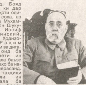
Устод Садриддин Айни ва шоири хунарманду навҷу Муҳаммадсиддиқи Ҳайрат доир ба бисёр масъалаҳои адабӣ ва ҳодисаҳои муҳими замон ҳаммақида буданд.

Омӯзиш ва муайян кардани ин масъалаҳо арзиши фаровони илмӣ, адабӣ ва таърихӣ