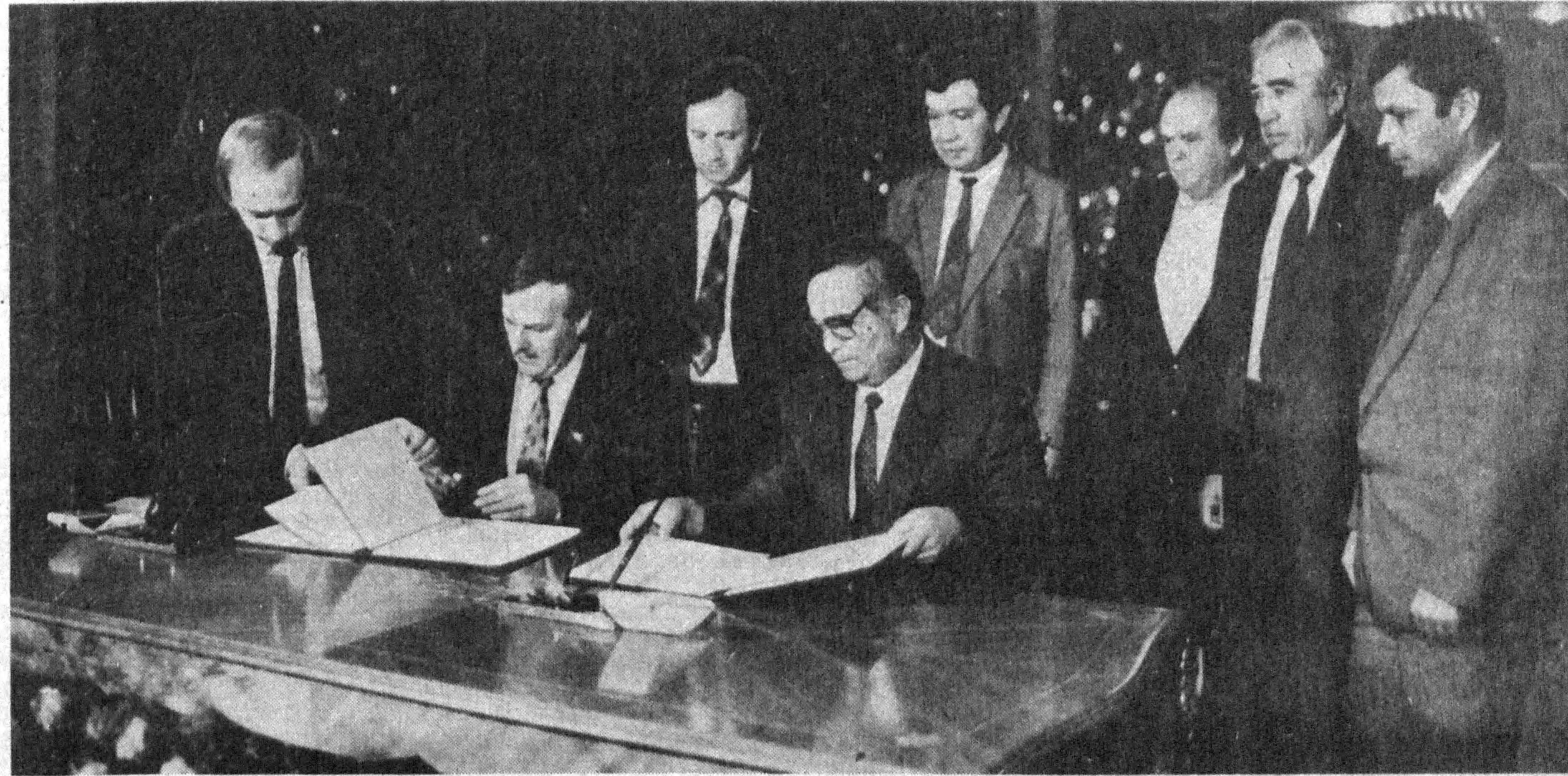
Ҳамкорликни ривожлантириш ҳақидаги ҳужжатни имзолаш.