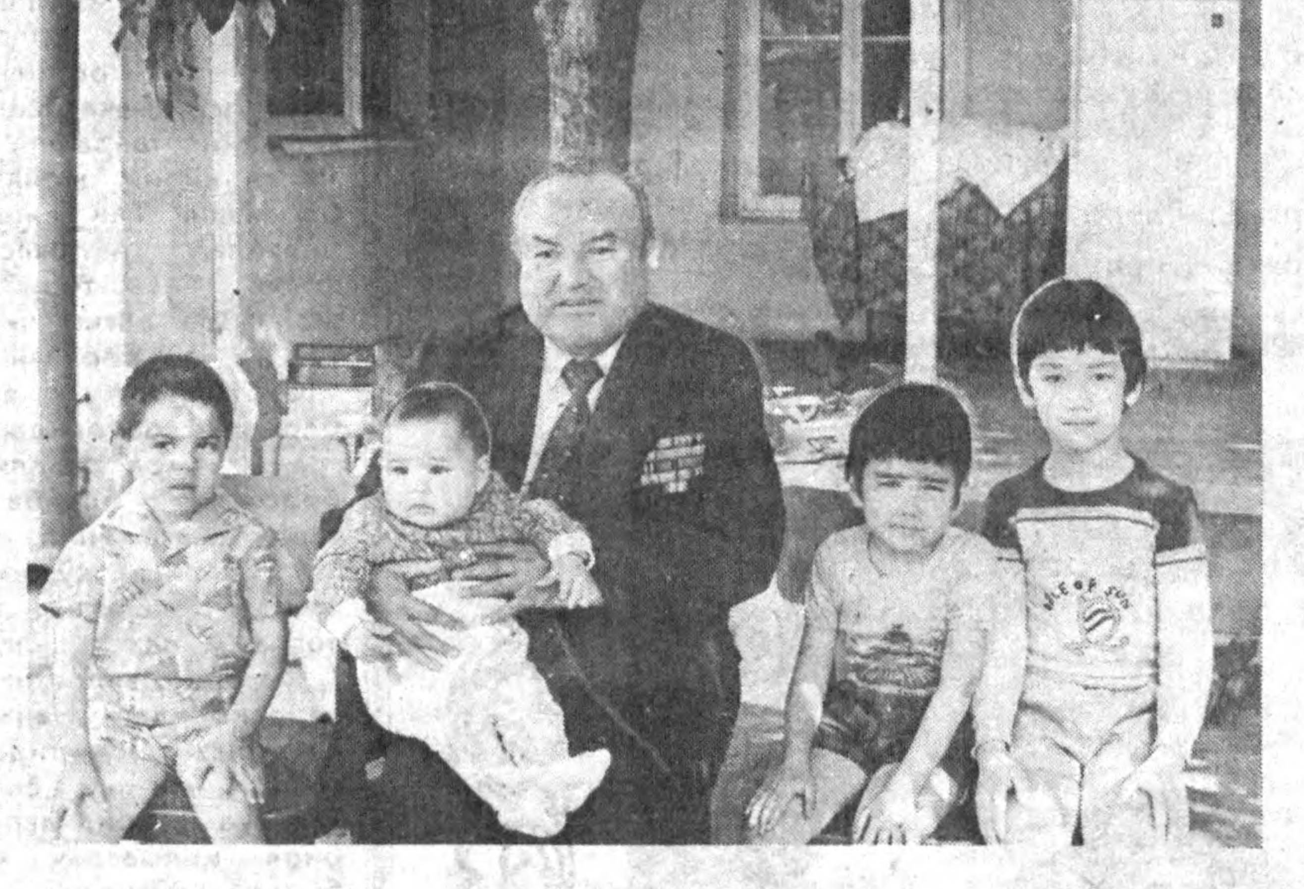
Қариб юз ёшга кириб, неварачевараларнинг меҳрибон, азиз бу вақонис бўлиб юриш қандай бахт!