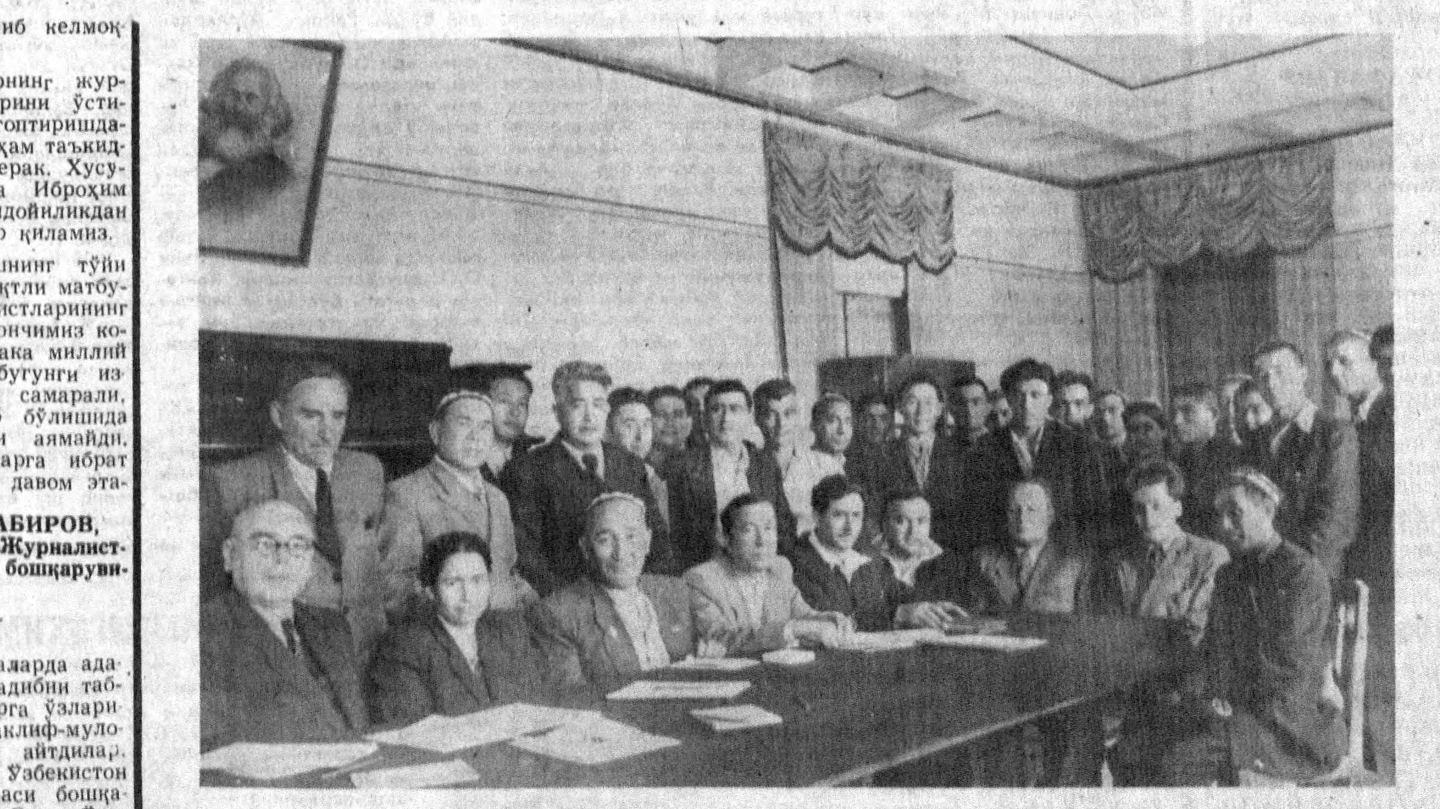
1953 йилда «Қизил Ўзбекистон» рўзномаси муҳарририятида туширилган ушбу тарихий суратда юбилар адибимизни адабиётимиз ва матбуотимизнинг машҳур, таниқли вакиллари даврасида нўриб турибсиз.

рашувларда, кечаларда ала-биёт муҳлислари адибни таъриқлаш билан бирга ўзлари нинг қимматли тақлиф-мулоҳазаларини ҳам айтишди. Учрашувларда Ўзбекистон ёзувчилар уюшмаси бошқарувининг раиси Одил Ёнубов, Ўзбекистон халқ шоирлари Ҳамид Гулом, Рамаз Бобоқоллар иштирок этишди.