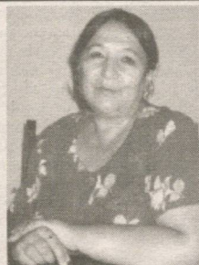
ЁРИМ ЭДИ ҚОШИ ҚАЛАМ

Дилгинамга тошлар отманг, Ёмон ботар золим тошлар. Кўзларимга сиймайди ҳеч, Бевафодан қолган ёшлар.