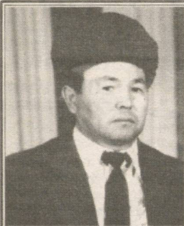
Ибодат ас­ли­да халққа хизмат­дир, На мас­жид, на жой­на­моз­да бу иш. М. С. Шерозий