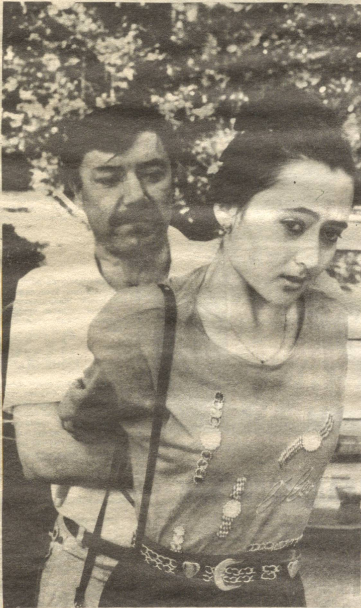
ЯНГИ ФИЛМДАН ЛАВҲА

Бола онасидан сўради: — Ойи, ойи... Сиз нимага кинода ўйнамайсиз? — Мен актриса эдимкики, кинода роҳ ўйнасам. — Бўлмаса нега дадамдан ҳар гап пул олганингизда «актёрликда мени айлда қолдириб кетасан», дейдилар?..