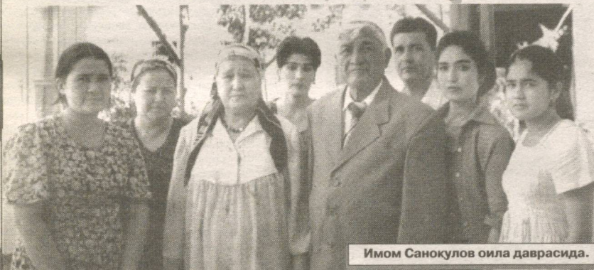
Имом Санокуллов оила даврасида.