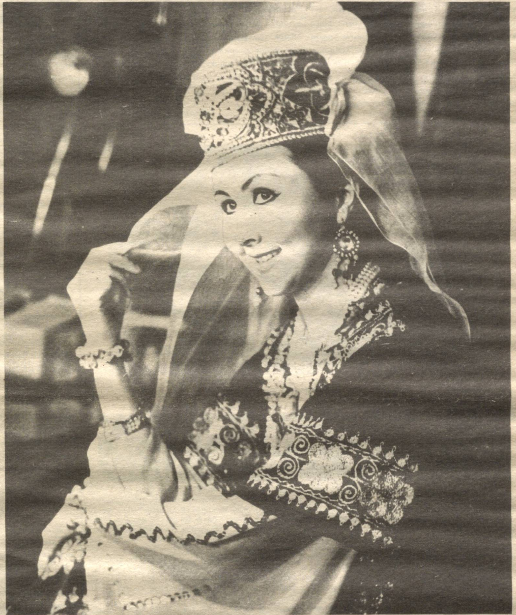
ХИРОМ АЙЛА, САРВИНОЗИ

— О, шундайми?! Унда иккита курсига ўтиринг,— деди.