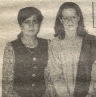
Ҳ. Исроилова Сония Ганди билан