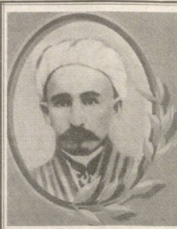
Аҳли ҷамъияти адабию илмӣ Самарқанд 120-солаги зодруди намояндаи машғури адабиёти эҷобӣ

Е худ дар вилояти Қашқадарё акси онро мебинед. Асбобу усулҳои варзишӣ, устодон ҳастанд аммо иншоотҳои варзишӣ намерасанд. Ба фикрҳои мутахассисон, намуноҳи асосии варзиш барои бачагон ҳуқуқбардорон варзиши сабук, шинаворӣ ва гимнастика баъде мебошанд. Ва ин намуноҳи варзиш бешак дар бачагон сифатҳои муҳими ҷисмонӣ-қувватро идрок, азму یرода, ҳис қардани зебоӣ ва ғайраҳо ба вучуд мебарорад. Ва ташаккули заминаи моддӣи тарбияи ҷисмонӣ ва варзиши бачагона, дар наватни аввал дар деҳот ба вучуд овардани шабаҳаҳои маҷмӯиҳои замонавӣи варзишӣ, бо таъқиботи варзишӣ ва асбобу усулҳои зарурӣ ҷиҳозқонидани варзишҳои новоба-