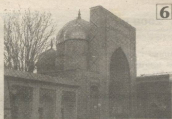
6 ЗАНГИ ОТА КИМ БЎЛГАН?