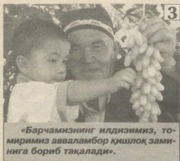
3 «Барчамизнинг илдизимиз, томиримиз авваламбор қишлоқ зами-нига бориб тақалади».