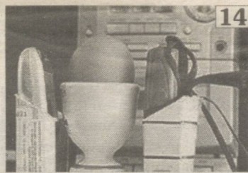
14 СОТКАДА ТУХУМ ПИШИРМАНГ