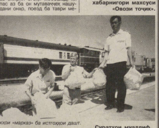
Қўмақҳои «марказ» ба истиқлолият дашт.