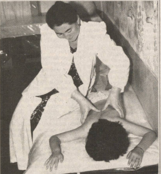
Дар кӯдакистони «Бунафаши»-и ноҳияи Дӯстиқии вилоти Сирдарё 340 нафар бачагон тарбия мегардан. Дар ин ҳолати баъри аз ҳар ҷиҳат мукамал тарбия гирифтани кӯдакон кулли шариҳтоҳ фароҳам оварда шудааст. Бахусус дар кӯдакистон бинобар барномаи «Соғлом авлод» корҳои ба назар намоеъне бурда мешавад.