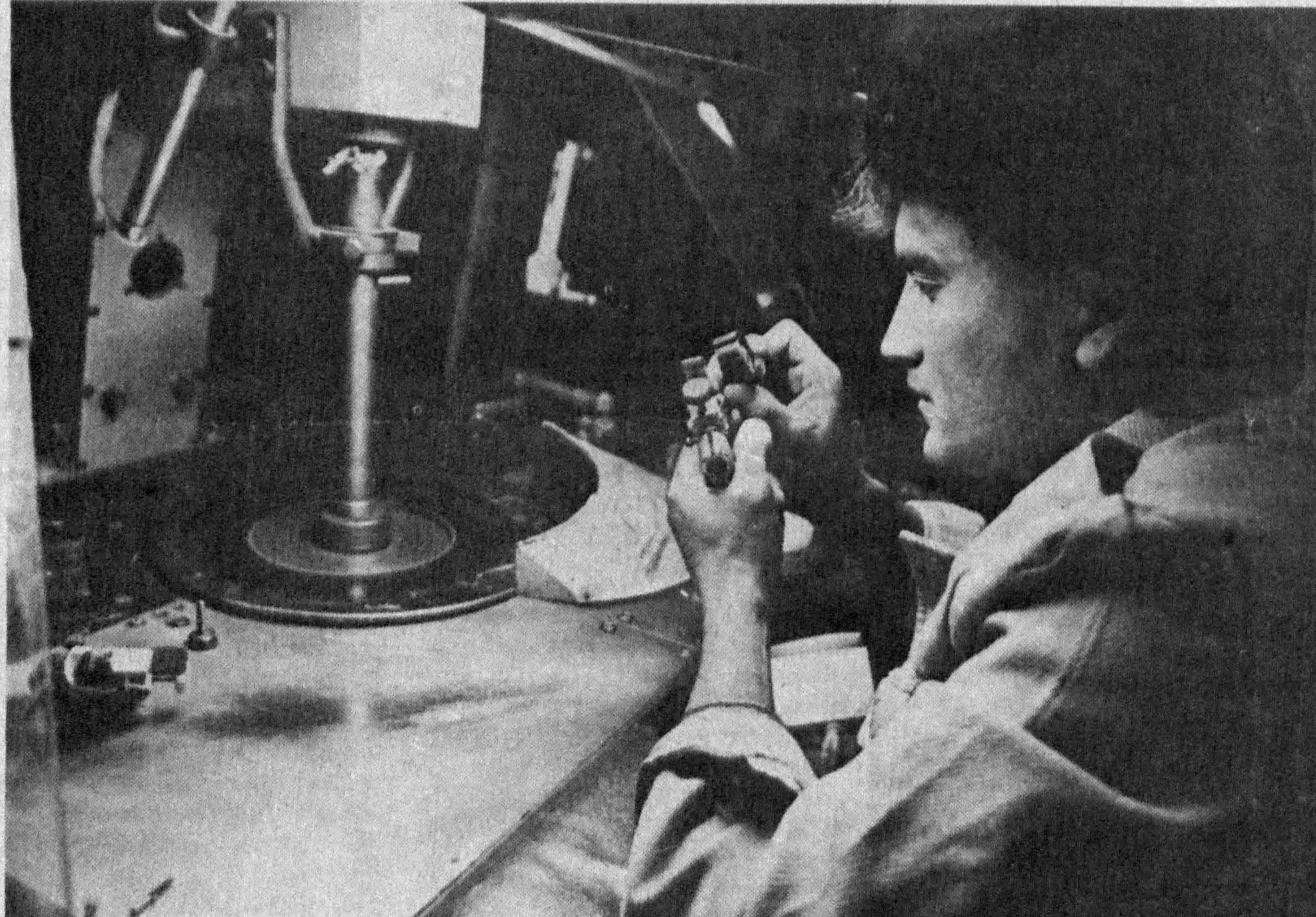
Тошкент вилоятидаги Бурчмулла қўرғонда Ўзбекистонда ягона оломсини қайта ишлаш заводи фаолият кўрсатмоқда. Завод бундан икки йил аввал Бўстонлик районидаги ёшларни иш билан таъминлаш мақсадида эски кон базасида ташкил этилган.