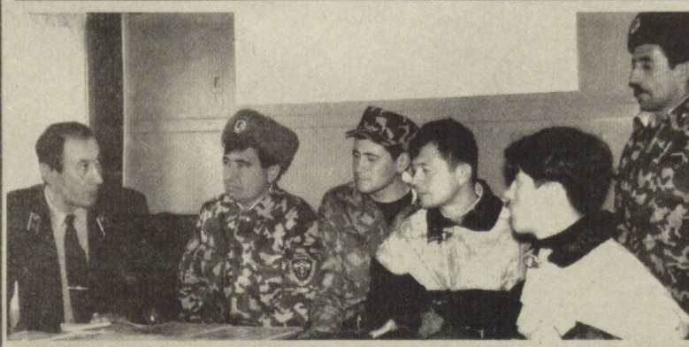
Дар сурат: рафти машғулоти дар шўбаи поезди сўкторхомушқунчи роҳи охани стансиани Қарши.

истифода аз анборҳо ва бинокҳои истеҳсолоти ёррасон маъмури ҳаҷлие, ки ӯ зиндагӣ кардааст, лавҳаи ёдгори мраммарӣ гузоштаанд.