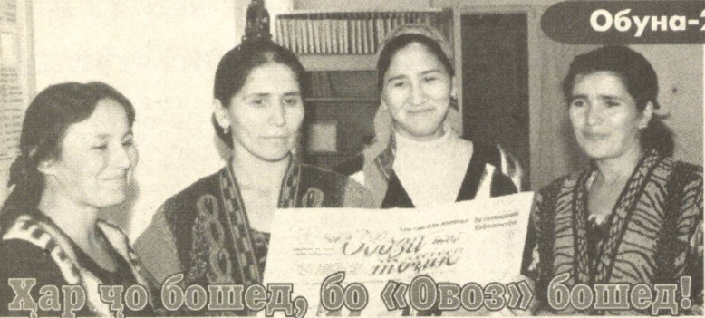
Ҳар чо бошед, бо «Овоз» бошед!

Мавсим асоси обуна ба нашриҳои даври ба ин расид. Аслан ба ин маъни «мавсим» баъри «вучуд надорад, зеро ҳар хоҳишманд баъри як моҳ, ду моҳ, ... ним сол ва ё ёздаҳ моҳ мезананд обуна шаванд. Барои ин то 15-уми ҳафт моҳ ба шӯъбаи алоқа муроҷиат карда, ба рӯзнома обуна шудан мумкин аст, то ки онро аз моҳи оянда дастрас намояд.