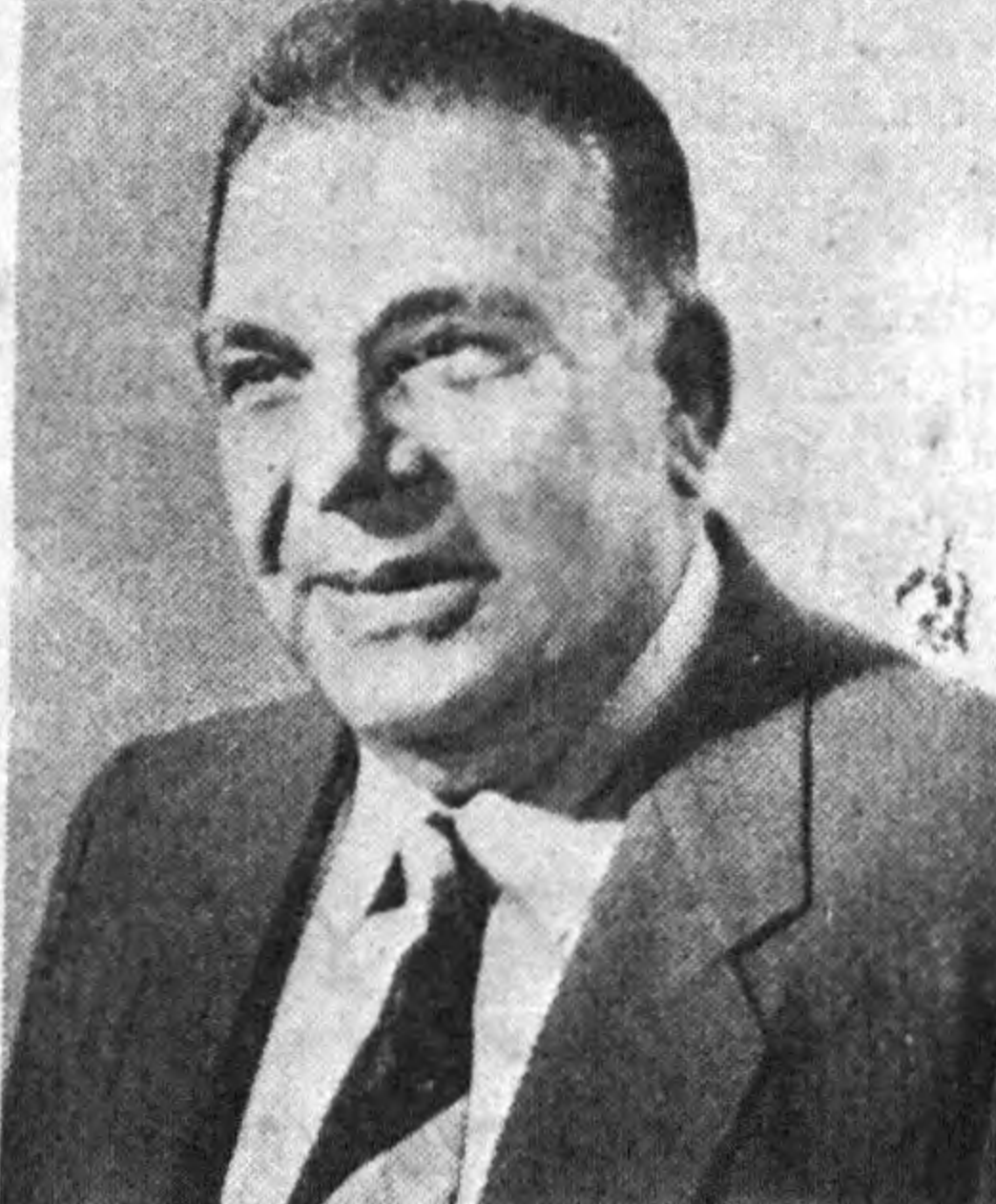
рувчи турли мутахассислар, иқтисодчилар, ишбилармонлар, олимлар, табиий ҳодимлар ва талабалар қаторида журналистлар ҳам бўлса халқларимиз ҳаётини бир-бирларига яқиндан таништириш мумкин бўларди...