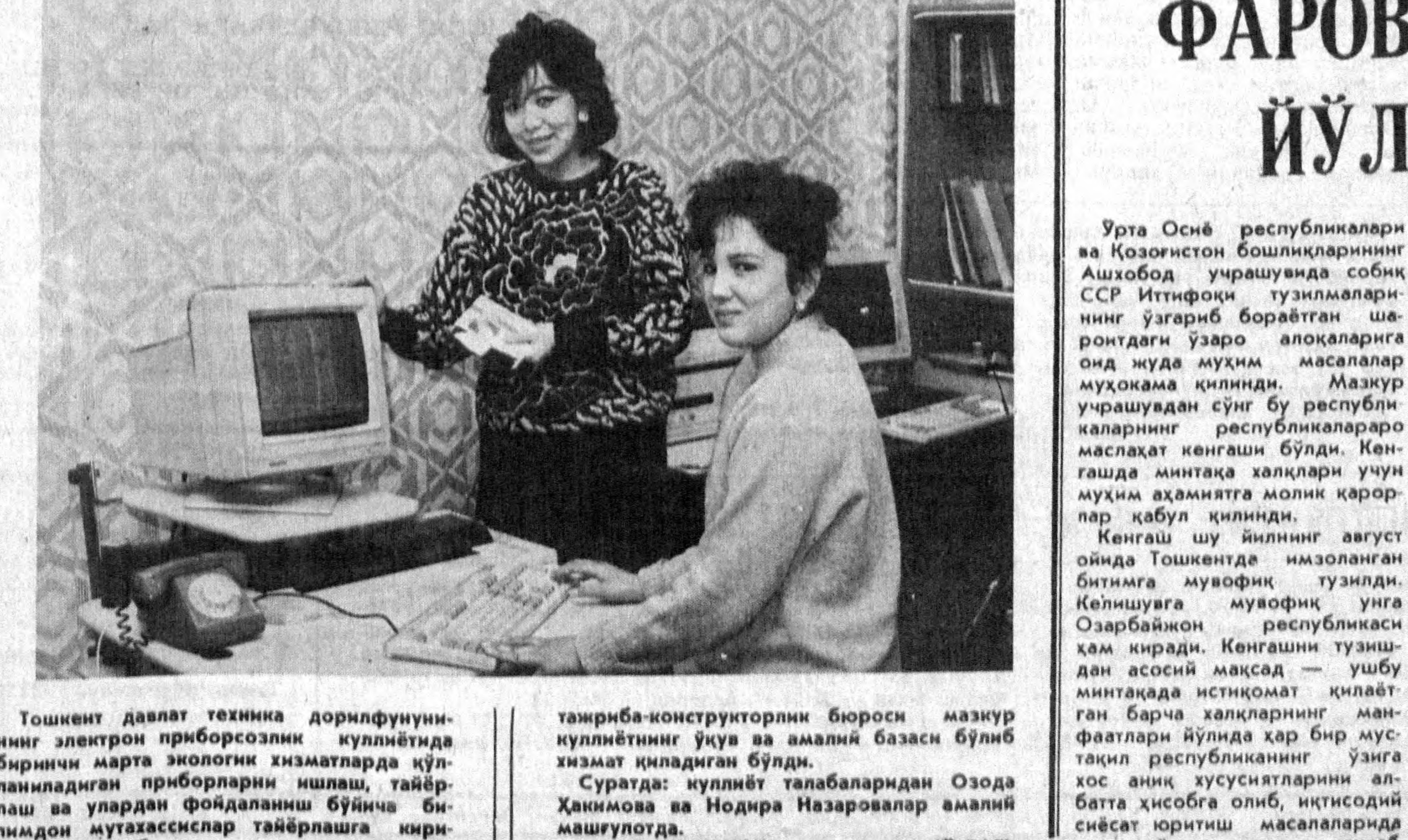
Тошкент давлат техника дорнлфунунининг электрон приборсозлик куллиетида биринчи марта экологик хизматларда қўлланиладиган приборларни ишлаш, таъйирлаш ва улардан фойдаланиш бўйича билимдон мутахассислар таъйирлашга киришилди. Республикадаги махсус аэроосмиқ таъйирла-конструкторлик бюроси, маъмур куллиетининг ўқув ва амалий базаси бўлиб хизмат қилаётган бўлди.

Ушбу маъракадаги муваффақиятларнинг сирини нимада? Биринчи галда соғин ситгирлар қатъий рақсон асосида боқилипти. Айни вақтда сут миқдорини оширадиган сервизини беда ва ишил озуқалар вақти-вақтида беришмоқда.