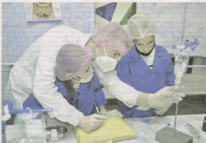
Год развития науки, просвещения и цифровой экономики

Порой, бывает, услышишь высказывание, что дети умнее взрослых. Несмотря на малый возраст, они владеют жизненной мудростью. И иногда их вопросы или сказанная ими фраза ставят в тупик пап и мам или дедушек и бабушек. Мы не находим, что ответить, или затрудняемся в объяснении. Но если в нашем окружении есть люди, которые могут не просто прийти на помощь в таких случаях, но и увлечь детей, то это становится спасением.