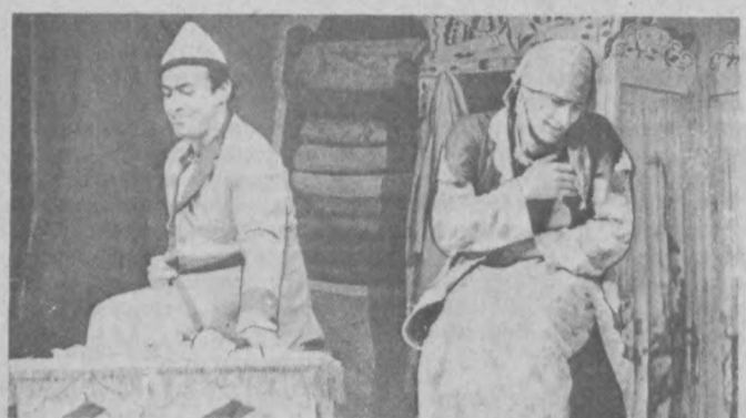
«Жонига бордим бир кеча...» спектаклидан кўриниш.

Қарши шаҳрида «Мулоқот» номда театр-студия ташкил этилганига кўп вақт бўлганича йўқ. Аммо ўтган икки йилдан кўпроқ давр мобайнида бу санъат жамоаси ижодий жиҳатдан шаклланиб, ўз репертуарини яратиб, эл эътиборига туша олди. Бугунги кунда «Мулоқот»ни Қашқадарёдагина эмас, балки бутун жумҳуриятимизда яхши билишди. Урта Осиё жумҳуриятлари ва Қозоғистон театр-студияларининг ўтган йили биринчи фестивали эса уни бутун минтақага таниди. Юксак ижрочилик намунасини кўрсатган коллективга анжуманининг Бош соврини топширилди.