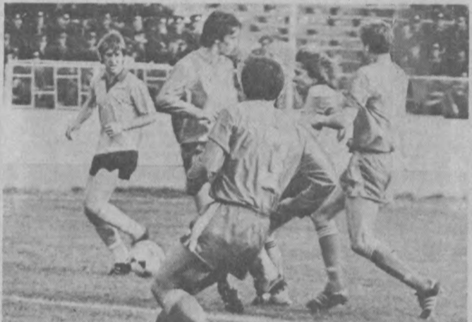
«Пахтакор»нинг олий лигага қайтиш йўли ҳақида баъзи мулоҳазалар

Ўзбекистонда футболсеварлар ҳаддан зиёд. Тўп сураётган болалардан ҳам, футбол учрашувдан завқланиб қайиқратган мухлислар ҳам өтарли. Афсуски, ўлкадагина эмас, Урта Осиёда қўнунлиқ актирданган «Пахтакор» неча йиллардан бери зўр ўқинлар кўрсатолмай, маъқенин мустаҳкамламай, бунинг устига қомандани учаро футболчилар» ҳисобига тўлдириб, мухлисларини ранжитиб,