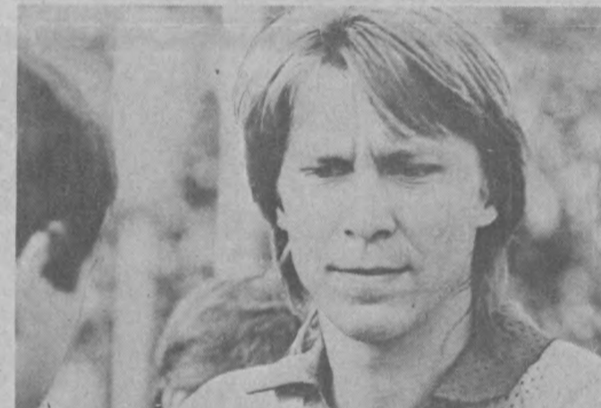
«Пахтакор» командаси номига мухлислардан табриклар ҳам келиб турган бўлса керак!