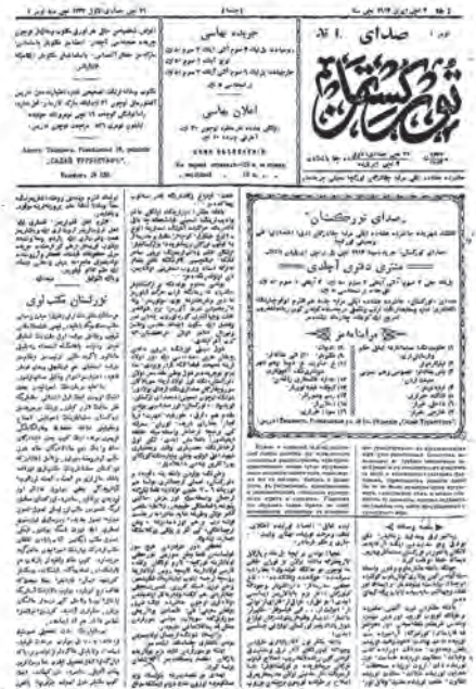
«Садои Туркистон» газетасининг 1-сонни. 1919 йил.

Таълим ислохоти ҳақида Мунавваркори, дунёга юзланиш, бошқалардан ортда қолмаслик, жамиятга суқилиб кериб келаётган янги омилларнинг туб аҳоли ҳаёт тарзига қай даражада уйғунлиги тўғрисида Бехбудий, жаҳолат кўйнидаги ҳаётни қай йўллар билан тараққиётга олиб чиқиш масаласида Қодирий, бадиий адабиётнинг туб