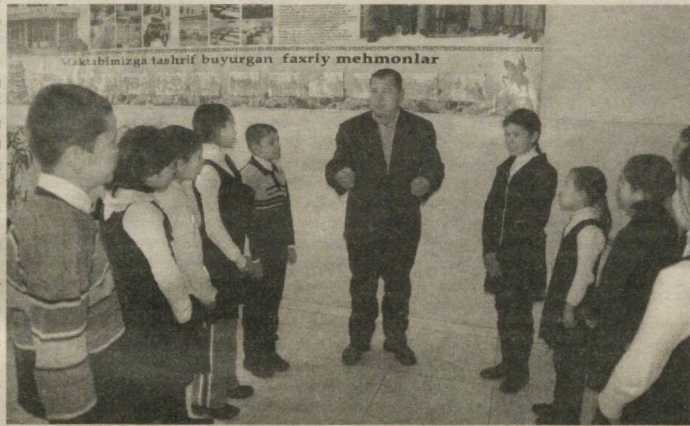
Maktabimizga tashrif buyurgan faxriy mehmonlar