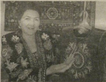
лий хунармандинчилик намуналаримиз ниҳоятда қадрли ва энг азиз совға саналади.