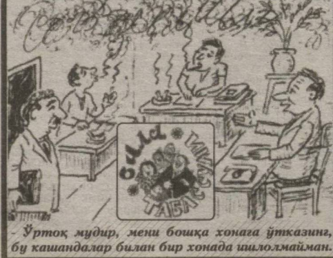
Уртоқ мудир, мени бошқа хонада ўтказин, бу кашандалар билан бир хонада ишолмайман.

7.30 "Хабарлар". 7.50 "Бардам бўлинг". 8.50 "Хабарлар" (рус тилида) 9.10 "Куноқ стартлар". 9.50 "Рақибингиз гроссмейстер". 10.10 "Табассум". 10.20 "Йўлда ёзилмаган қайдлар". 10.35 "Ҳамама уйдалигида". 11.30 "Файзли ошхона". 11.55 Футбол.