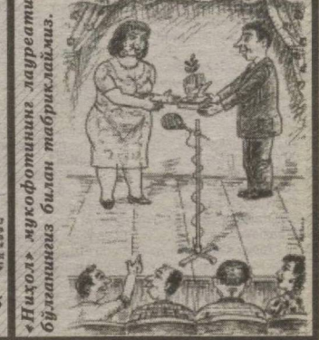
"Нихол" мусофотининг лауреати бўлганингиз билан табриқлаймиз.