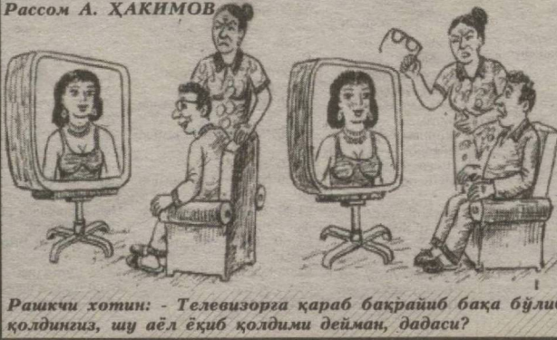
Рашикчи хотин: - Телевизорга қараб бақрайиб бақа бўлиб қолдингиз, шу аёл ёқиб қолдимиз дейман, дадаси?