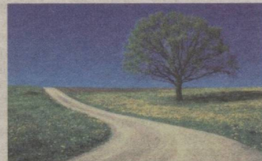
АГАР МЕН... 8