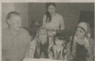
ДУО БИЛАН КЎКАРАР ЭЛ 2