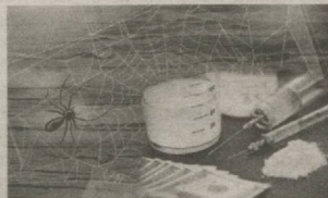
КЕЧИККАНДАН ИЛЛАТ КЕЧМАЙДИ 6