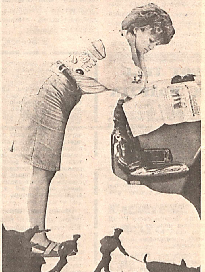
ИЗДАНИЕ КОЛЛЕГИИ МВД РЕСПУБЛИКИ УЗБЕКИСТАН

Стоимость подписки на нашу газету, выходящую три раза в неделю, на 1992 год повышаться не будет! 15 рублей 60 копеек и ни копейки больше! Наш индекс в каталоге—64616. Подписка оформляется без ограничений в любом почтовом отделении связи на любой срок и с любого месяца.