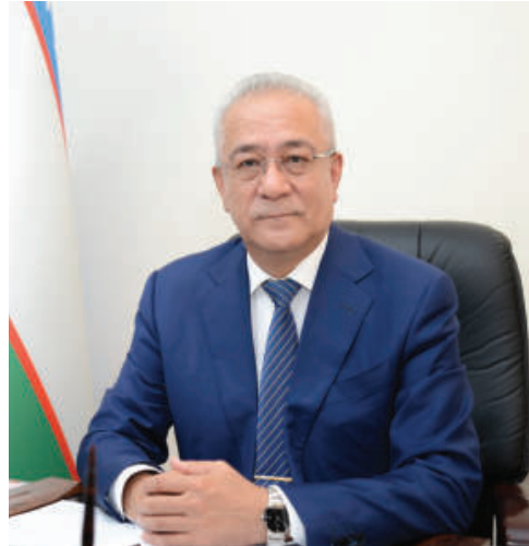
Исматулла ИРГАШЕВ, Ўзбекистон Президентининг Афғонистон масалалари бўйича махсус вакили