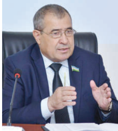
Зокирjon ГАДОЕВ, Олий Мажлис Сенати Бюджет ва иқтисодий ислохотлар масалалари кўмитаси раиси

“2021 йил учун Ўзбекистон Республикасининг Давлат бюджети тўғрисида”ги Ўзбекистон Республикаси Қонунининг асосий мақсади республика бюджети ажратмаларини тасдиқлаш, бюджет жараёни ва даражалари ўртасидаги муносабатларни тартибга солиш ҳамда 2021 йил учун мамлакатимизнинг консолидациялашган бюджетини ҳамда уларни тайёрлаш учун асос бўлган макроиқтисодий ривожланиш прогнозлари тўғрисида маълумотларни маъқуллашдан иборат.