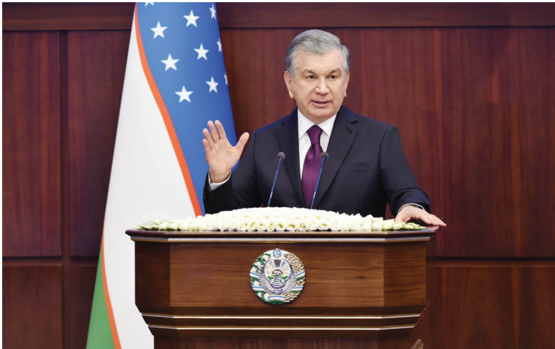
12 январь куни Президент Шавкат Мирзиёев мамлакатимиз ҳаётидаги муҳим воқеа — Ўзбекистон Республикаси Қуролли Кучлари ташкил топганининг 29 йиллиги ва Ватан ҳимоячилари куни арафасида Қуролли Кучлар академиясига ташриф буюрди.

Давлат раҳбари ўқув муассасаси фаолиятини такомиллаштириш бўйича амалга оширилган ишлар ва у ерда яратилган таълим инфратузилмаси объектлари, шунингдек, Қуролли Кучларимизнинг замонавий қурол ва ҳарбий техника намуналари ҳамда миллий мудофаа саноати корхоналари томонидан ишлаб чиқарилган маҳсулотлар билан танишди. Шундан сўнг Академияда Ўзбекистон Республикаси Президенти, Қуролли Кучлар Олий Бош Қўмондонни раислигида Қуролли Кучлар ва ҳарбий-маъмурий секторлар фаолиятининг 2020 йил янунлари ҳамда келгусидаги устувор вазифаларга баъшланган Хавфсизлик кенгашининг кенгайтирилган йиғилиши бўлиб ўтди. Тадбирда Хавфсизлик кенгаши аъзолари, Қуролли Кучларнинг раҳбар ва қўмондонлик таркиби, жойлардаги давлат ҳокимияти органлари раҳбарлари ҳамда жамоат ташкилотлари вакиллари иштирок этди.