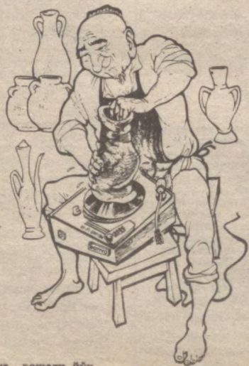
Изоҳнинг ҳожати йўқ...

— Көксайди-да бу одамлар, — дедим қанақа жавоб беришимни билмай.