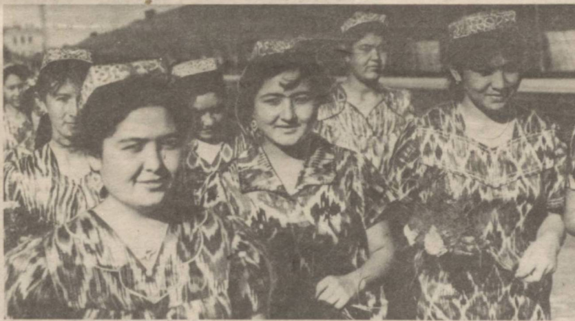
Ўзгаллисининг кўрки қизлар...