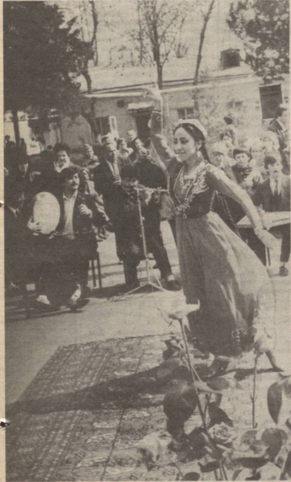
Шеър, оҳанг ва гўзаллик тантанаси.

Ўрта асрларда дафтарларнинг ҳам альбом деб аташган. Бундай дафтарларга ўз аждодларининг тарихини, файласуфларнинг фикрларини ва давлат арбобларининг буйруқларини ёзишган. XVIII асрда варақлар турли рангдаги альбомлар пайдо бўлган. Бу хил альбомларга шоврлар ўз шеърларини ёзишган, расомлар расмлар чизишган. Ҳозирги вақтда эса альбомлар жуда кўп рангда ва ҳар хил катта-кичикликда