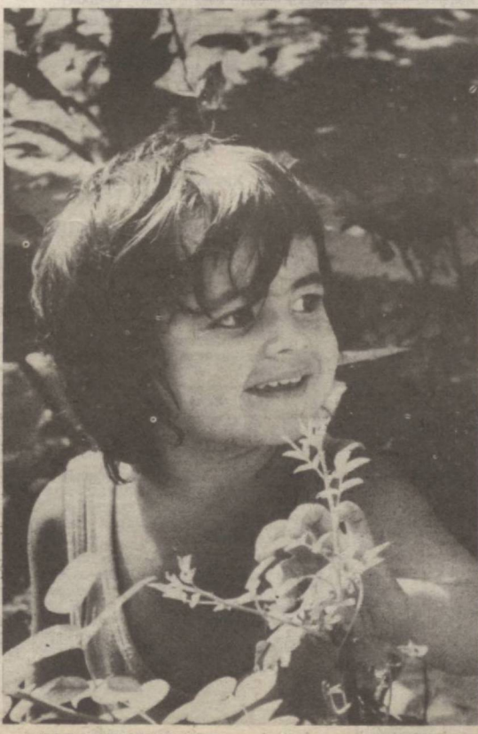
БОЛАЛИК ҲАЙРАТИ.