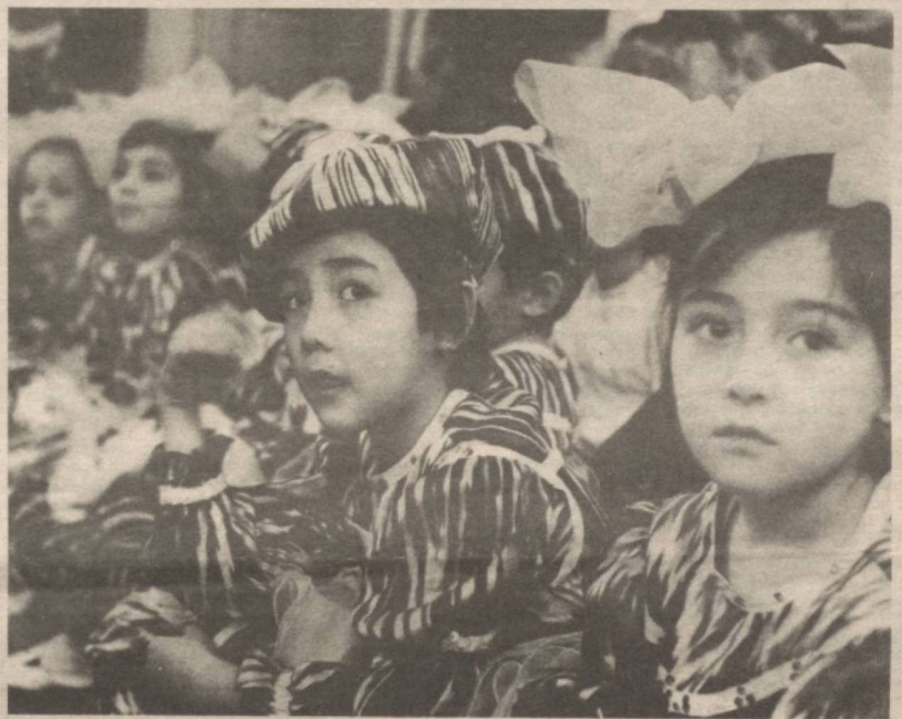
Ўдақлар — поклиги билан улудир, Соддалиги билан каттадир, биздан....

Ўзбекистон Республикаси Алоқа вазирлиги номидан бир гуруҳ фахрийларга табриқномалар ва қимматбаҳо мукофотлар топширилди.