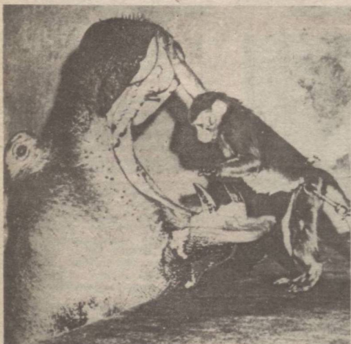
Сен қандай изоҳлайсан?

Бироз дейди, тезроқ уйла, Бироз дейди: шовма, ўйла, Нима қилдик энди, Тулан Уйланайми, ўйланайми!