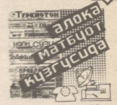
ТЕЛЕФОННИ УЗИБ ҚЎЙИШДИ

Кенгаш мажлисида йил охиригача йўл қўйилган амалчиликларни бартараф этишни талаб этувчи қарорлар қабул қилинди. Концерн девони ишини янада жонлантириш, хизмат кўрсатишни аҳоли талабларига тўла жавоб берадиган даражага етказиш муҳимдир.