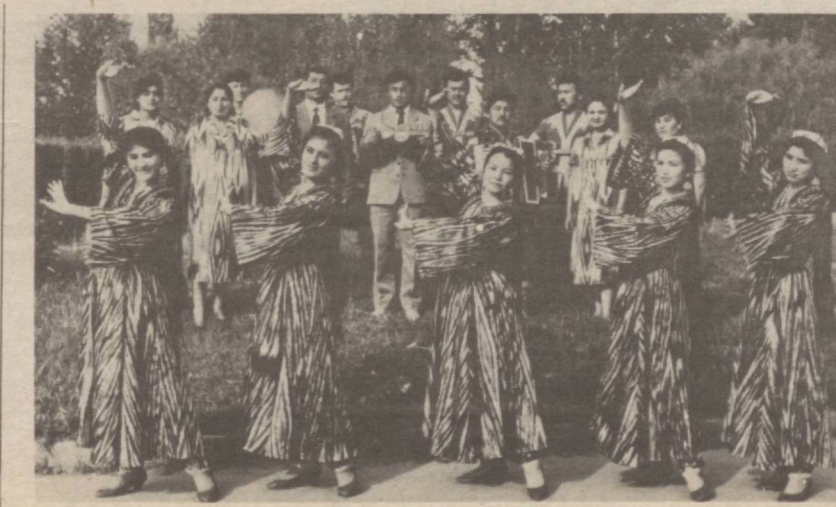
Фаргона вилояти Қўва туманидаги «Анор» халқ ансамбли.

Кабоб тайёрлаш Европада VII асрдан бошлаб расм бўлган ва у сурьяликлар томонидан олиб келинган деган тахминлар мавжуд.