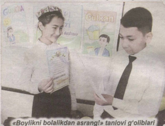
«Boyligni bolalikdan asrang!» tanlovi g'oliblari