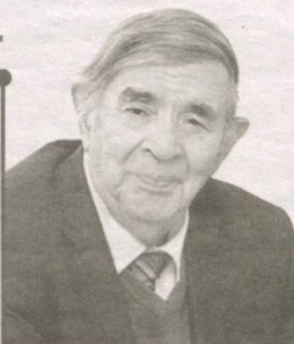
Xudoyberdi TO'XTABOYEV, O'zbekiston xalq yozuvchisi