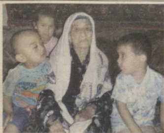
Дуо билан эл кўқарар 3