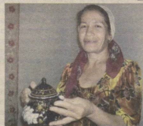
Меҳмон улугми, ёки мезбон? 8