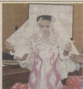
Тарози посангиси 6