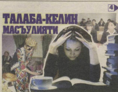
ТАЛАБА-КЕЛИН МАСЪУЛИЯТИ 4