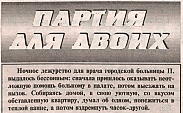
Ночное дежурство для врача городской больницы П. выдалось бессонным: сначала пришлось оказывать неотложную помощь больному в палате, потом выезжать на вызов. Собираясь домой, в свою уютную, со вкусом обставленную квартиру, думал об одном, понежиться в теплой ванне, а потом вздремнуть часок-другой.

началу результативность, — вспоминает старший оперуполномоченный ОУР Э. Ташметов, — отчаиваться не стали, а продолжали искать другие пути, способные вывести на воров.