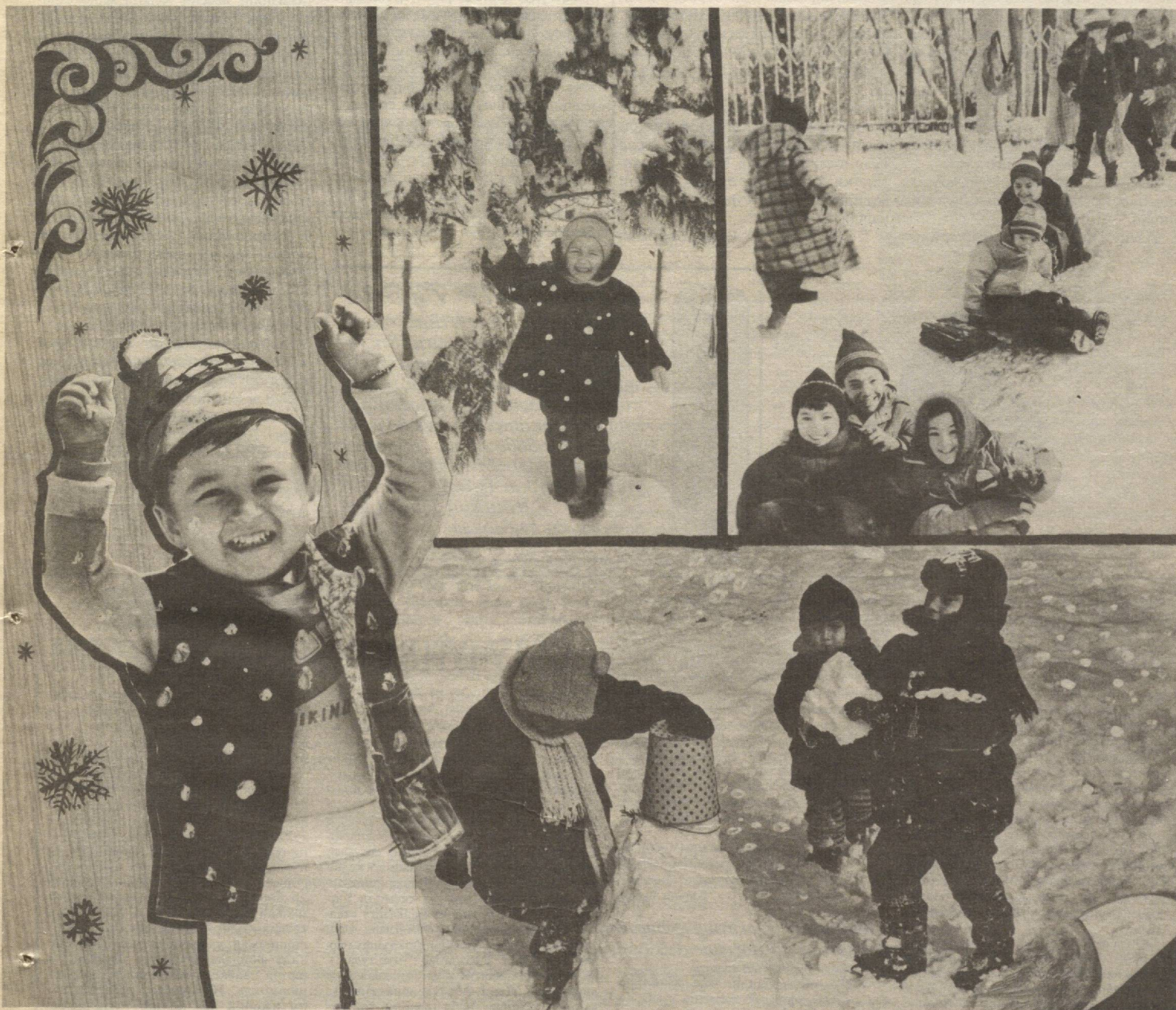
— Ва ниҳоят биз кутган дамлар келди...

Ўза ва республика матбуоти хабарлари асосида тайёрланди