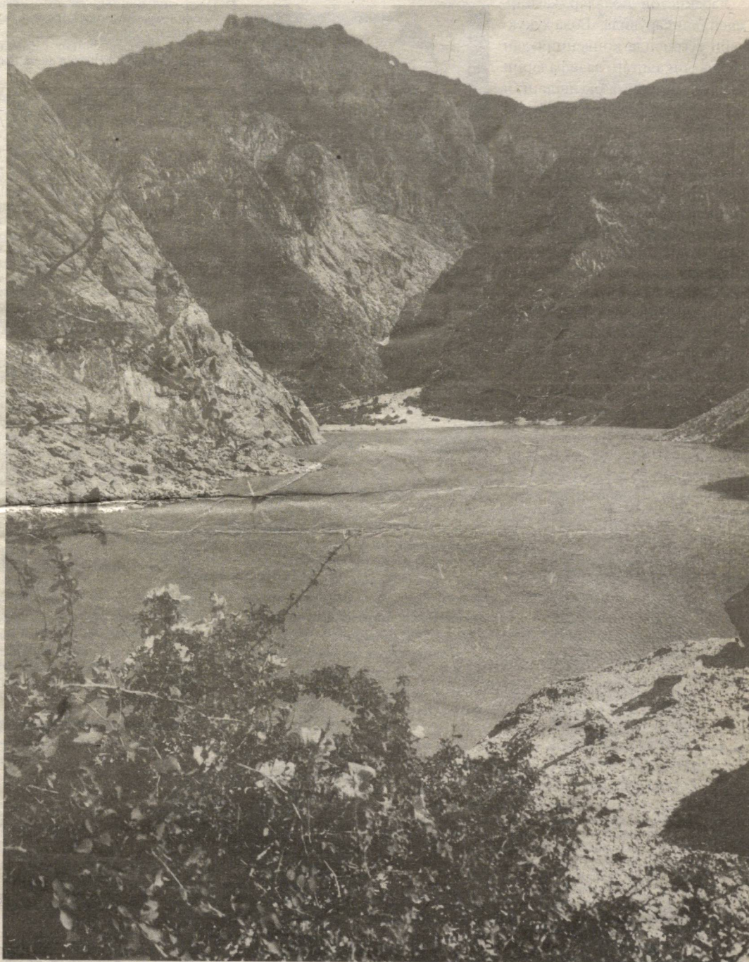
Чотқолда баҳор

Ўза ва республика матбуоти хабарлари асосида тайёрланди