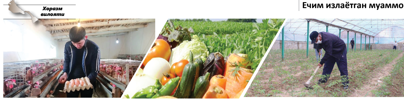
Ечим излаётган муаммо