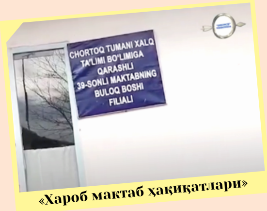
«Хароб мактаб ҳақиқатлари»

Таҳририятнинг янги лойиҳаси – «ISHONCH» NISHONIDA! барчасига ҳолис видео нигоҳ ташламоқда!