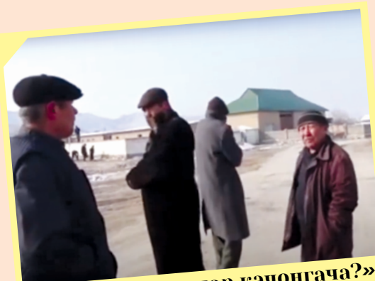
«Қоп-қоп ваъдалар қачонгача?»