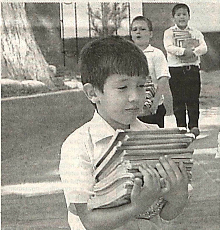
За каникулы все прочитаем!

Должен сказать, что в нашей стране, где порядка 40 процентов от общего числа населения составляют несовершеннолетние граждане, делается немало для благополучия подрастающего по-