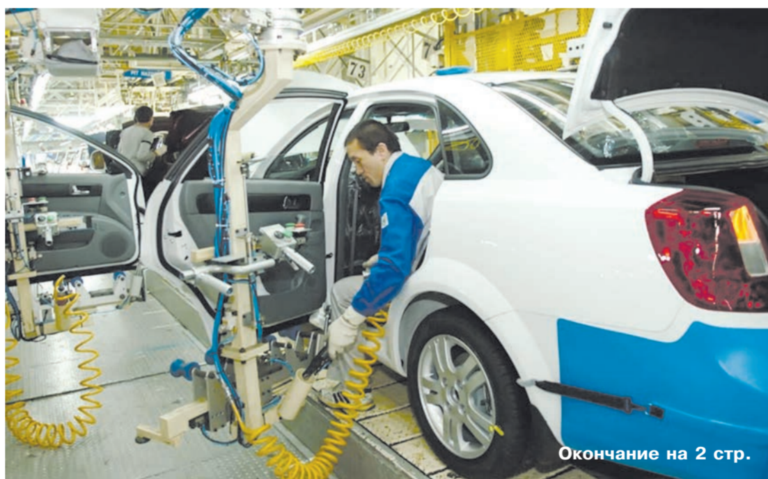
Окончание на 2 стр.

На очередном, пятидесятом, заседании Центрального комитета Международной Евразийской Федерации металлистов (МЕФМ), проходившем в онлайн-формате, заслушана информация о социально-экономической ситуации в странах и членских организациях, входящих в данное профсоюзное объединение, в период продолжающейся пандемии.