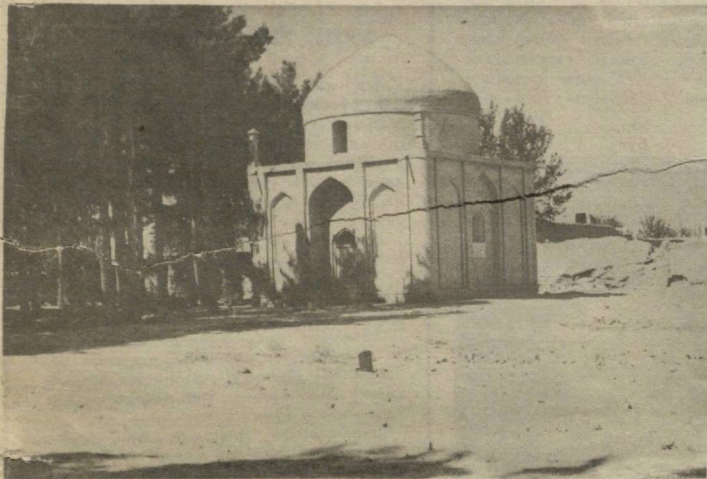
АЛИШЕР НАВОЙИ ҚАБРИ (АФҒОНИСТОН).