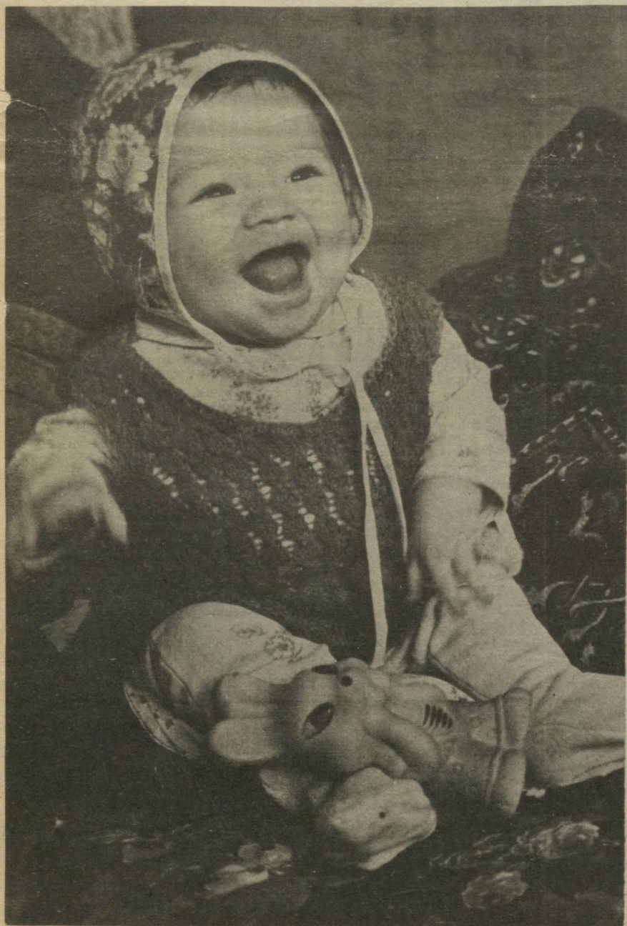
— ҚУЕНЧАМ УХЛАБ ҚОЛДИ