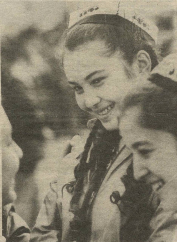
«ВОЙ, У ШУНАҚА ЙИГИТКИ...»

Келин бўлаётган қизлар диққати- га! Ижара [прокат]га келин куйлак бери- лади. Тел: 57-19-17