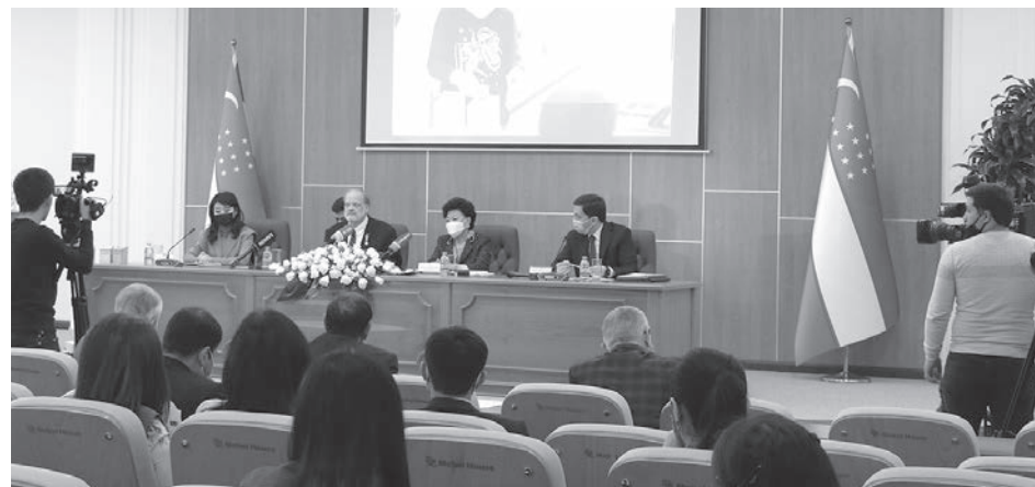
(Окончание. Начало на 1-й стр.)

Сегодня во многих развитых странах мира действуют законы, направленные не только на эффективное использование природных ресурсов, но и охрану окружающей среды. За годы независимости в Узбекистане осуществлены важные реформы, нацеленные на повышение устойчивости экосистем, сохранение и улучшение состояния биологических ресурсов и сокращение экологических рисков. Так, в статье 55 Конституции Республики Узбекистан отражено: «Земля, ее недра, воды, растительный и животный мир и другие природные ресурсы являются общенациональным богатством, подлежат рациональному использованию и охраняются государством». Политика экологической безопасности нашей страны проводится на основе Конституции, принципов Декларации Рио-де-Жанейро по окружающей среде и развитию и Йоханнесбургской декларации по устойчивому развитию с учетом обязательств, вытекающих из международных конвенций и соглашений, а также законодательного опыта развитых стран.