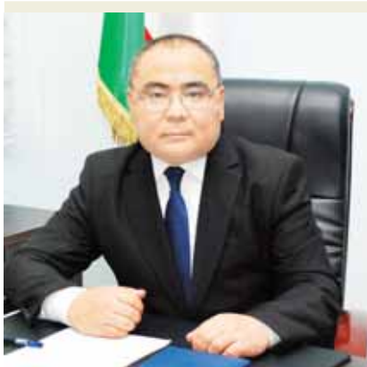
Иброҳим АБДУРАҲМОНОВ, инновацион ривожланиш вазири, академик.

Яқинда бўлиб ўтган йирик тадбирлар — давлатимиз раҳбарининг Олий Мажлиси Мурожаатномаси, Ўзбекистон ёшларининг биринчи форуми ҳамда Хавфсизлик кенгашининг кенгайтирилган йиғилишида ҳам маънавият йўналишидаги долзарб вазифаларга тўхталиб ўтилган эди. Чунки бу борада ечимини кутиб турган, ўзгаришлар шамоли кириб бормасан масалалар кўп.