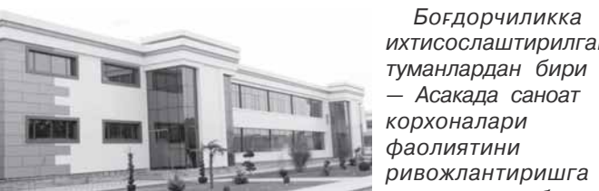
Богдорчиликка ихтисослаштирилган туманлардан бири — Асакада саноат корхоналари фаолиятини ривожлантиришга алоҳида эътибор қаратишмоқда. Жумладан, "Asaka Textile" МЧЖда ип йиғиришдан бошлаб тайёр маҳсулотга айлангунча бўлган жараён тизимли ташкил этиляпти.

Бундан ташқари, мавжуд хавфни бошқариш тизими орқали, агар Боғжона юк дек-