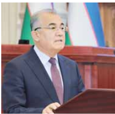
Акmal САЙДОВ, Олий Мажлис Қонунчилик палатаси Спикерининг биринчи ўринбосари.

Мамлакатимизда олиб борилаётган янги демократик ҳамда эркин Ўзбекистонни яратишга қаратилган кенг қамровли ва изчил ислохотлар доирасида халқ ҳокимиятчилиги конституциявий таомиллини ҳаётга татбиқ этиш, фуқароларнинг давлат ҳамда жамият бошқарувидаги иштирокини таъминлаш, сайлов қонунчилигини такомиллаштиришга алоҳида эътибор берилмоқда. Зеро, демократик ва адолатли сайловлар демократиянинг ўта муҳим ва зарур шартларидан ҳисобланади.