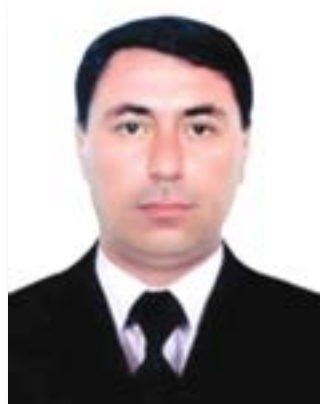
Алишер АБДУҒАНИЕВ, Зомин тумани ҳокими

Шириной УМАРАЛИЕВА, Ўзбекистон касба уюшмалари Федерацияси Меҳнат инспекциясининг Сирдарё вилояти бўйича хуқуқ ва техник инспектори