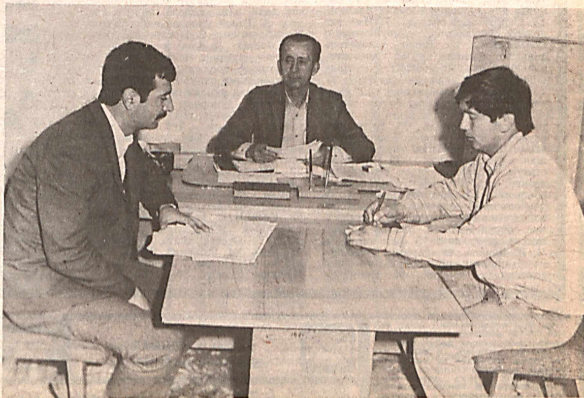
Оперативные задачи решают сотрудники отделения уголовного розыска отдела внутренних дел Чиназского райисполкома. В центре — начальник отделения майор милиции С.