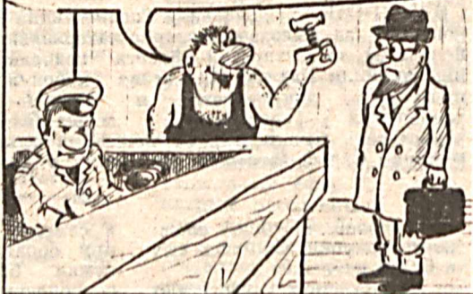
Рис. В. Белобородова.

А У МЕНЯ, ПРОФЕССОР, КАЖДЫЙ ДЕНЬ-ОТКРЫТИЯ!