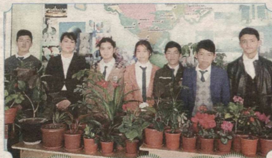
Termiz shahridagi 4-umumta'lim maktab-internatining 8-sinf o'quvchilari o'rtasida bo'lib o'tgan «Senga mehrim yo'g'rilgan gulni sovg'a qilaman» nomli tanlovdan lavha.