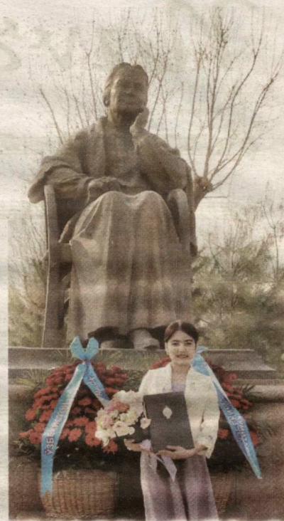
2018-yilda Gyote instituti tomonidan 70 dan ortiq davlatdan kelgan 10–11-sinf o'quvchilari orasida o'tkazilgan nemis tili bo'yicha xalqaro olimpiadada ishtirok etdim va g'oliblikni qo'lga kiritdim.