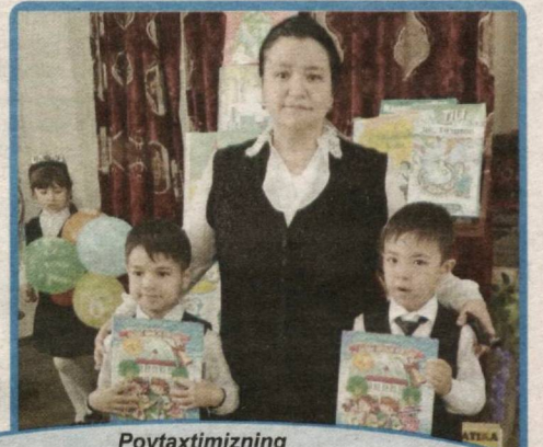
Poytaxtimizning Shayxontohur tumanidagi 13-umumta'lim maktabining boshlang'ich sinflarida «Bolaga kitob bering!» tadbirlari bo'lib o'tmoqda.