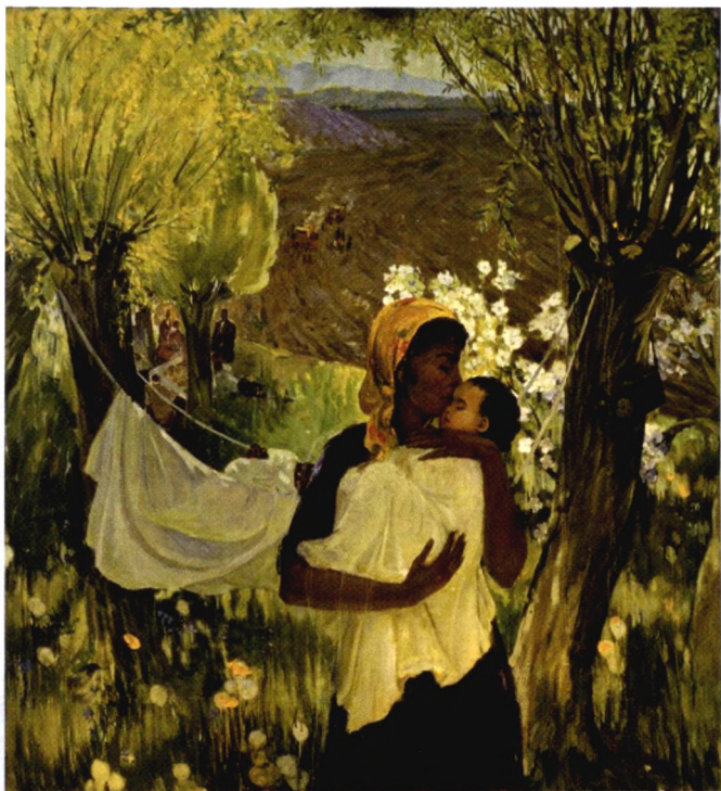
Весной. Ташкент, 1985