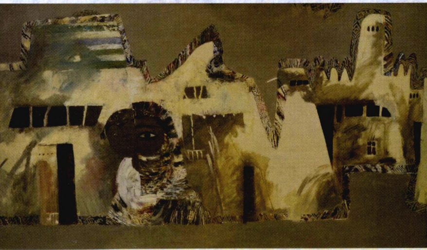
Хива. Ташкент, 2002