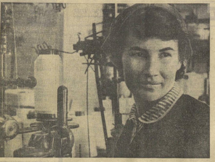
Коллектив первого взаимного цеха Кокандского научно-производственного комбината готовит и планирует производство Советского государства...